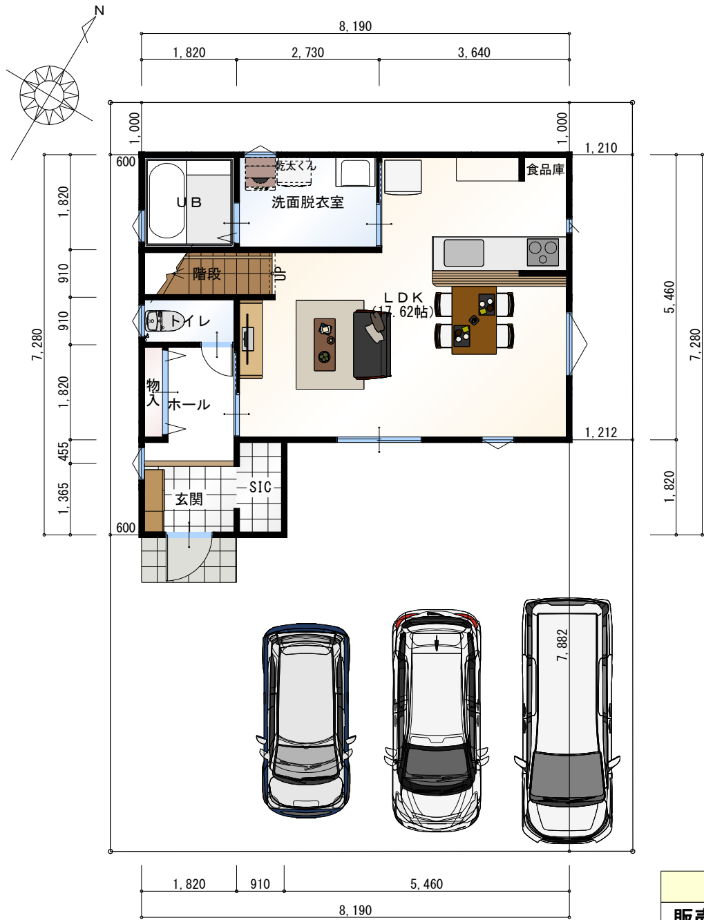
1階 平面図 S:1/100