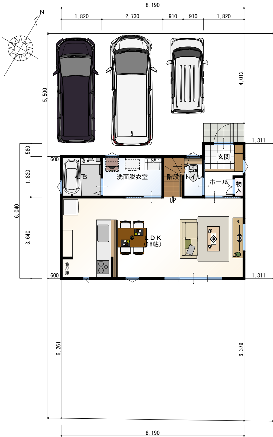
1階 平面図 S:1/100