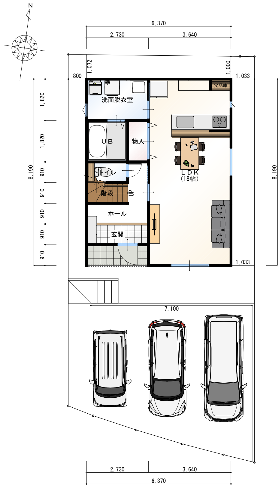
1階 平面図 S:1/100