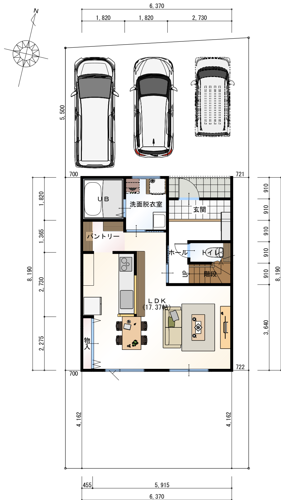
1階 平面図 S:1/100